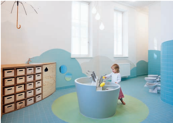
Bild 3. Das Bad lädt zum Wasserspielen ein