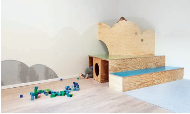
Bild 2. Podeste in allen Räumen befriedigen den Bewegungsdrang