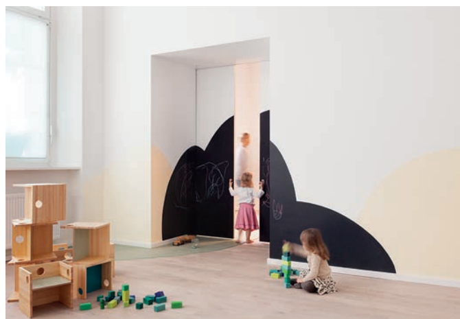
Bild 1. Ein schwebendes Schirmmobile begrüßt die Kinder morgens (Bild links); In der Garderobe sind die Haken wie Wassertropfen geformt (Bild rechts oben); Wolken aus Wandfarbe inspirieren zum Malen (Bild rechts unten)